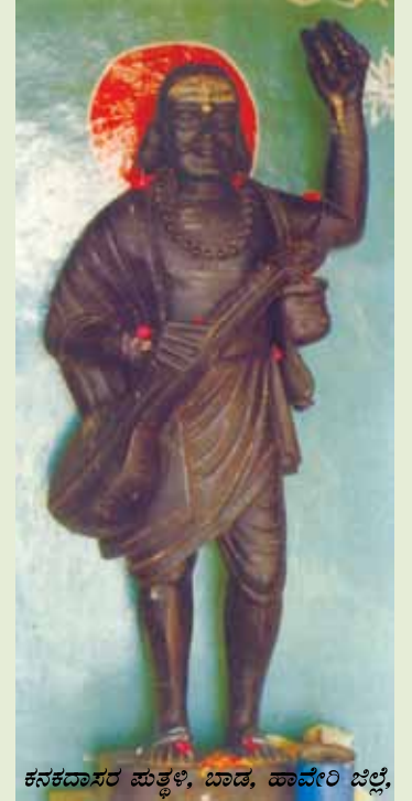
ಕನಕದಾಸರ ಪುತ್ಥಳಿ, ಬಾಡ, ಹಾವೇರಿ ಜಿಲ್ಲೆ

ರಚನೆಗಳನ್ನು ಪುರಂದರ ಉಪನಿಷತ್ತುಗಳೆಂದು ಜನಪ್ರಿಯವಾಗಿ ಕರೆಯಲಾಗುತ್ತದೆ. ಅದರ ಭಾಷೆಯು ಕಾವ್ಯಮಯವಾಗಿದ್ದು, ಸಾಮಾನ್ಯ ಜೀವನಾನುಭವದಿಂದ ಕಲ್ಪನಾ ಶ್ರೀಮಂತಿಕೆಯಿಂದ ಕೂಡಿದ ರೂಪಕೋಕ್ತಿ ಹಾಗೂ ಸಾಮ್ಯಗಳನ್ನು ಹೊಂದಿದೆ. ಕರ್ನಾಟಕದ ಮತ್ತೊಬ್ಬ ಮಹಾನ್ ಸಂತರಾದ ಶ್ರೀ ಕನಕದಾಸರು, ಹಾವೇರಿ ಜಿಲ್ಲೆಯ, ಹಾನಗಲ್ ತಾಲ್ಲೂಕಿನ ಬಾಡಗ್ರಾಮದವರು. ಸಮಕಾಲೀನರಾದ ಪುರಂದರದಾಸರಂತೆ, ವೆಂಕಟಪತಿಯ ಆರಾಧನೆ ಮಾಡಲು ಲೌಕಿಕ ವಾಂಚಲ್ಯಗಳನ್ನು ಪರಿತ್ಯಾಗ ಮಾಡಿ, ಪ್ರೇಮ ಸಿದ್ಧಾಂತದ ಬೋಧನೆಯನ್ನು ಮಾಡಿದರು. ಇವರ ಕೃತಿಗಳಾದ ಹರಿ ಭಕ್ತಿಸಾರ, ಮೋಹನ ತರಂಗಿಣಿ, ನಳಚರಿತ್ರೆ ಹಾಗೂ ರಾಮಧ್ಯಾನ ಚರಿತ್ರೆಗಳು ಕರ್ನಾಟಕದಲ್ಲಿ ಧರ್ಮ ಹಾಗೂ ಹರಿದಾಸ ಚಿಂತನೆ ಮತ್ತು ಸಿದ್ಧಾಂತಗಳ ಮೇಲೆ ಗಣನೀಯವಾದ ಪರಿಣಾಮವನ್ನು ಬೀರಿವೆ.