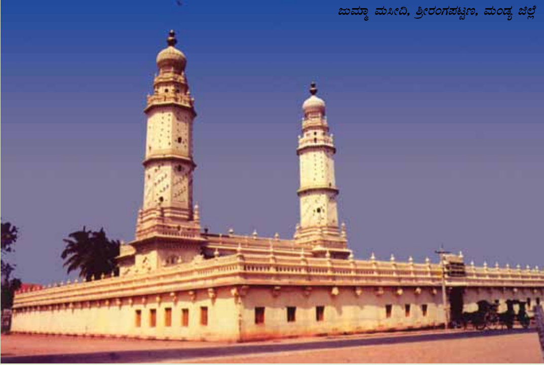
ಜುಮ್ಮಾ ಮಸೀದಿ, ಶ್ರೀರಂಗಪಟ್ಟಣ, ಮಂಡ್ಯ ಜಿಲ್ಲೆ