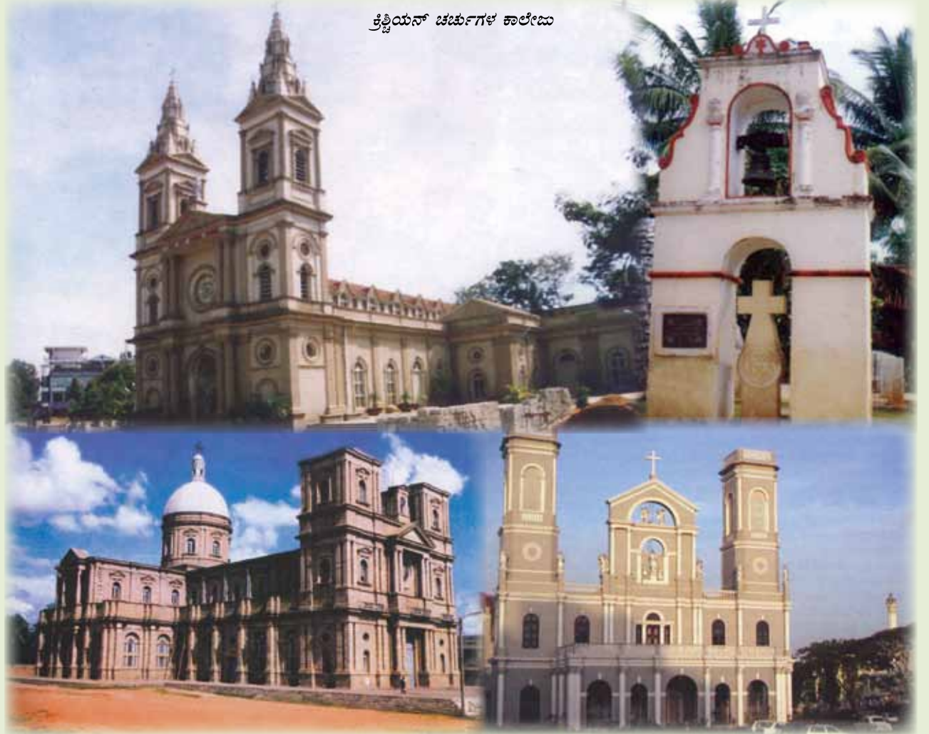
ಕ್ರಿಶ್ಚಿಯನ್ ಚರ್ಚುಗಳ ಕಾಲೇಜು

ಎಲ್ಲಾ ಕಾಲದಲ್ಲೂ, ಸಹಿಷ್ಣುತೆಯ ಭಾವವು ಸ್ಥಿರವಾಗಿ ಹಾಗೂ ನಿರಂತರವಾಗಿ ಮುಂದುವರಿಯಿತು. ಕರ್ನಾಟಕದಲ್ಲಿ ಜೈನ ಧರ್ಮವು ಅಭ್ಯುದಯವಾದಾಗ, ಜೈನ ಗುರುಗಳಿಗೂ ವೇದ ಧರ್ಮದ ಗುರುಗಳಿಗೆ ತೋರುವ ಗೌರವವನ್ನೇ ನೀಡಲಾಯಿತು, ಅದೇ ವಿಶ್ವಾಸವನ್ನು ಕಾಳಾಮುಖಿ ಗುರುಗಳಿಗೂ ತೋರಿಸಲಾಯಿತು. ವಿಷ್ಣುವರ್ಧನನು ಜೈನ ಧರ್ಮದಿಂದ ಹೊರಬಂದಿದ್ದರೂ, ಜೈನರಿಗೆ ಕಿರುಕುಳ ನೀಡಿದನೆಂಬ ಅಸ್ಪಷ್ಟ ಊಹೆಗಳ ಹಿನ್ನೆಲೆಯಲ್ಲಿ, ಅದನ್ನು ಅಲ್ಲಗಳೆಯಲು, ಆತನು ಜೈನ ಬಸದಿಗಳಿಗೆ ಅನುದಾನಗಳನ್ನು ನೀಡಿದನೆಂದು ಸಾಬೀತುಪಡಿಸುವ ಸಾಧಾರ ದಾಖಲೆಗಳು ಇವೆ. ಅಷ್ಟೇ ಅಲ್ಲ, ರಾಜ್ಯವೊಂದರ ರಾಜನು ವೈಯುಕ್ತಿಕವಾಗಿ ನಿರ್ದಿಷ್ಟ ಮತವೊಂದರ ಹಿಂಬಾಲಕನಾದರೂ, ತನ್ನ ಪ್ರಜೆಗಳು ಯಾವುದೇ ಧರ್ಮದ ಅನುಯಾಯಿಗಳಾಗಲಿ, ಅವರನ್ನು ರಕ್ಷಿಸುವ ಆದ್ಯ ಕರ್ತವ್ಯದಿಂದ ಹಿಮ್ಮುಖನಾಗುತ್ತಿರಲಿಲ್ಲ. ವಿಜಯನಗರದ ಅರಸರು ವಿವಿಧ ಧಾರ್ಮಿಕ ಮತಗಳ ನಡುವೆ ಚರ್ಚೆಗಳನ್ನು ನಡೆಸಿದರು. ಅದೇ ಶತಮಾನದ ಅಂತ್ಯದ ವೇಳೆಗೆ