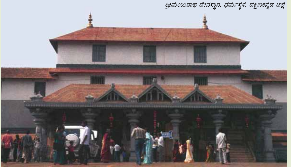
ಶ್ರೀಮಂಜುನಾಥ ದೇವಸ್ಥಾನ, ಧರ್ಮಸ್ಥಳ, ದಕ್ಷಿಣಕನ್ನಡ ಜಿಲ್ಲೆ

ಕೀರ್ತನೆಗಳ ರೂಪದಲ್ಲಿ ಬೃಹತ್ ಪ್ರಮಾಣದ ಸಾಹಿತ್ಯವನ್ನು ಈ ಸಂತರು ಕಟ್ಟಿದರು. ಇವು ಆಧುನಿಕ ಕನ್ನಡ ಗದ್ಯ ಹಾಗೂ ಕಾವ್ಯದ ಮಾದರಿಗಳಾದವು. ಜನರನ್ನು ರಂಜಿಸುವ ಕೀರ್ತನೆಗಳನ್ನು ಹಾಡುತ್ತಾ, ತಂಬೂರಿಯನ್ನು ಹಿಡಿದು ಕಾಲ್ನಡಿಗೆಯಲ್ಲಿ ಸ್ಥಳದಿಂದ ಸ್ಥಳಕ್ಕೆ ಸಂಚರಿಸುತ್ತ, ಕಷ್ಟ-ಕಾರ್ಪಣ್ಯ ಹಾಗೂ ಬಡತನವನ್ನು ತಿರಸ್ಕರಿಸಿ, ಸತ್ಯ, ಸದ್ಗುಣ ಹಾಗೂ ದೈವಭಕ್ತಿಗಳನ್ನು ರೂಢಿಸಿಕೊಂಡ ಜೀವನವನ್ನು ಜನರು ನಡೆಸುವಂತೆ ಆಗ್ರಹಿಸುತ್ತ ಸಂಚರಿಸುವುದು ಈ ಸಂತರ ಸಂಪ್ರದಾಯವಾಯಿತು. ಅದೇ ವೇಳೆಗೆ, ಮಾನವ ಹೃದಯಕ್ಕೆ ನಾಟುವ ರೀತಿಯಲ್ಲಿ ಉಪನಿಷತ್ತುಗಳ ಕಠಿಣ ಚಿಂತನೆಗಳನ್ನು ಸರಳ, ಸುಶ್ರಾವ್ಯ, ರಾಗಯುಕ್ತ ಪದ್ಯದ ರೂಪದಲ್ಲಿ ಅವರು ತಿಳಿಸಿದರು. ಆತ್ಮ-ಸಾಕ್ಷಾತ್ಕಾರದ ಸಾಧನೆಗೆ ಸಂಗೀತದ ದೈವತ್ವದಲ್ಲಿ ನಂಬಿಕೆ ಹೊಂದಿದ ಮಹಾರಾಷ್ಟ್ರದ ಸಂತರಂತೆ ಹರಿದಾಸರೂ ಕೂಡ, ತಮ್ಮ ಸ್ವಂತ ಕೀರ್ತನೆ ಹಾಗೂ ಸಂಗೀತವನ್ನು ಅವಳಿಗಳೆಂದು ಪರಿಗಣಿಸಿದರು. ತತ್ಪರಿಣಾಮವಾಗಿ, ದೇವರ ಪ್ರೀತಿಗೆ ತಮ್ಮನ್ನು ತಾವು ಅರ್ಹರಾಗಿಸಿಕೊಳ್ಳಲು, ಎಲ್ಲಾ ಹರಿದಾಸರೂ ರಾಗ, ತಾಳ ಹಾಗೂ ಶೃತಿಗಳಲ್ಲಿ ನಿಷ್ಣಾತರಾಗಿದ್ದರು. ಬಹುಮಟ್ಟಿಗೆ, ಹರಿದಾಸರು ಮಧ್ವರ ವೈಷ್ಣವ ಪಂಥಕ್ಕೆ ಸೇರಿದವರಾಗಿದ್ದಾರೆ.