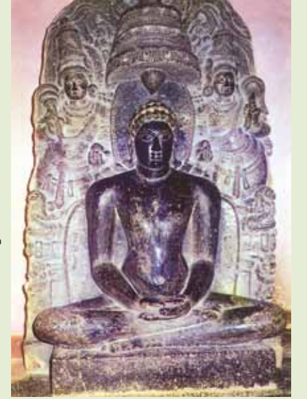
ಜೈನ ತೀರ್ಥಂಕರ, ಗುಡಗೇರಿ, ಧಾರವಾಡ ಜಿಲ್ಲೆ

ಪ್ರಾರಂಭಿಕ ಚರಿತ್ರೆಯಲ್ಲಿ ಬೀರಿರಬಹುದಾದ ಬೌದ್ಧ ಧರ್ಮದ ಯಾವುದೇ ಪ್ರಭಾವವು, ಅದನ್ನು ಪಂಥವಾಗಿ ಪರಿವರ್ತಿಸದೆ, ಎಲ್ಲ ಜೀವಿಗಳ ಪಾವಿತ್ರತೆ ಹಾಗೂ ನಮ್ಮದಲ್ಲದ ನಂಬಿಕೆಗಳ ಕುರಿತಾಗಿ ಪೂಜ್ಯಭಾವವನ್ನು ತಾಳುವ ಚಿಂತನೆಯ ಸಾಮಾನ್ಯ ಹರಡುವಿಕೆಗೆ ಸೀಮಿತವಾದಂತೆ ತೋರುತ್ತದೆ. ಇತರ ವಿಷಯಗಳಲ್ಲದೆ, ಶಿಲಾ ಶಾಸನ ೧೨ರಲ್ಲಿ 'ಎಲ್ಲ ಧರ್ಮಗಳ ಅನುಯಾಯಿಗಳ ಆಧ್ಯಾತ್ಮಿಕ ಬಲದ ಹೆಚ್ಚಳ, ಸೂಕ್ತವಾದ ಸಂದರ್ಭಗಳು ಬಂದಂತೆಲ್ಲ ಇತರ ಧರ್ಮದ ಅನುಯಾಯಿಗಳನ್ನು ಸೂಕ್ತವಾಗಿ ಗೌರವಿಸಬೇಕು ಹಾಗೂ ಎಲ್ಲ ಧರ್ಮಗಳ ಅನುಯಾಯಿಗಳೂ ವಿವಿಧ ಧರ್ಮಗಳಲ್ಲಿ ನಿಷ್ಣಾತರಾಗಿದ್ದು ಭದ್ರವಾದ ಸದಾಚಾರದ ಸಿದ್ಧಾಂತವನ್ನು ಹೊಂದಿರಬೇಕು,' ಎಂದು ಹೇಳುತ್ತದೆ.