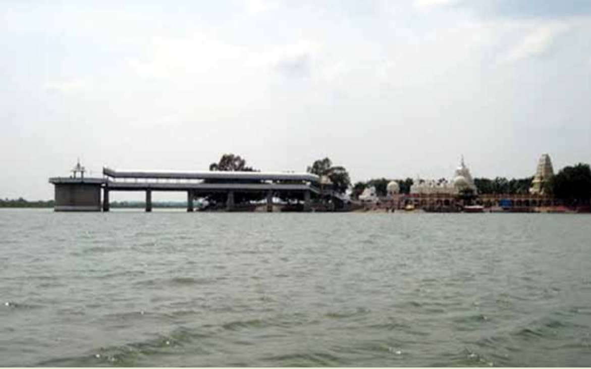
ಕೂಡಲ ಸಂಗಮದ ಸಂಗಮೇಶ್ವರ ದೇವಸ್ಥಾನ