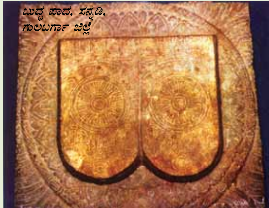
ಬುದ್ಧ ಪಾದ, ಸನ್ನಡಿ, ಗುಲಬರ್ಗಾ ಜಿಲ್ಲೆ

ಸುಮಾರು ಕ್ರಿ.ಪೂ. ಮೂರನೆಯ ಶತಮಾನದಲ್ಲಿ ಮಹಿಷಮಂಡಲ (ಮೈಸೂರು) ಹಾಗೂ ಬನವಾಸಿಗಳಿಗೆ (ಉತ್ತರ ಕನ್ನಡ) ಅಶೋಕನು ತನ್ನ ಬೌದ್ಧ ಧರ್ಮಪ್ರಚಾರಕರನ್ನು ಕಳುಹಿಸಿದರೂ, ಕರ್ನಾಟಕದಲ್ಲಿ ಬೌದ್ಧಮತದ ಪ್ರಭಾವವು ಅಷ್ಟೊಂದು ತೀವ್ರವಾಗಿರಲಿಲ್ಲ. ಕರ್ನಾಟಕದ ಕೊಪ್ಪಳ, ಮಸ್ಕಿ, ಸಿದ್ದಾಪುರ ಮುಂತಾದೆಡೆ ದೊರಕಿರುವ ಅಶೋಕನ ಶಿಲಾಶಾಸನಗಳು, ಕರ್ನಾಟಕದಲ್ಲಿ ಬುದ್ಧನ ಸಂದೇಶವನ್ನು ಸಾರುವ ಆತನ ಯತ್ನಗಳಿಗೆ ಮತ್ತಷ್ಟು ಸಾಕ್ಷಿಗಳನ್ನು ನೀಡುತ್ತವೆ. ಕರ್ನಾಟಕದ