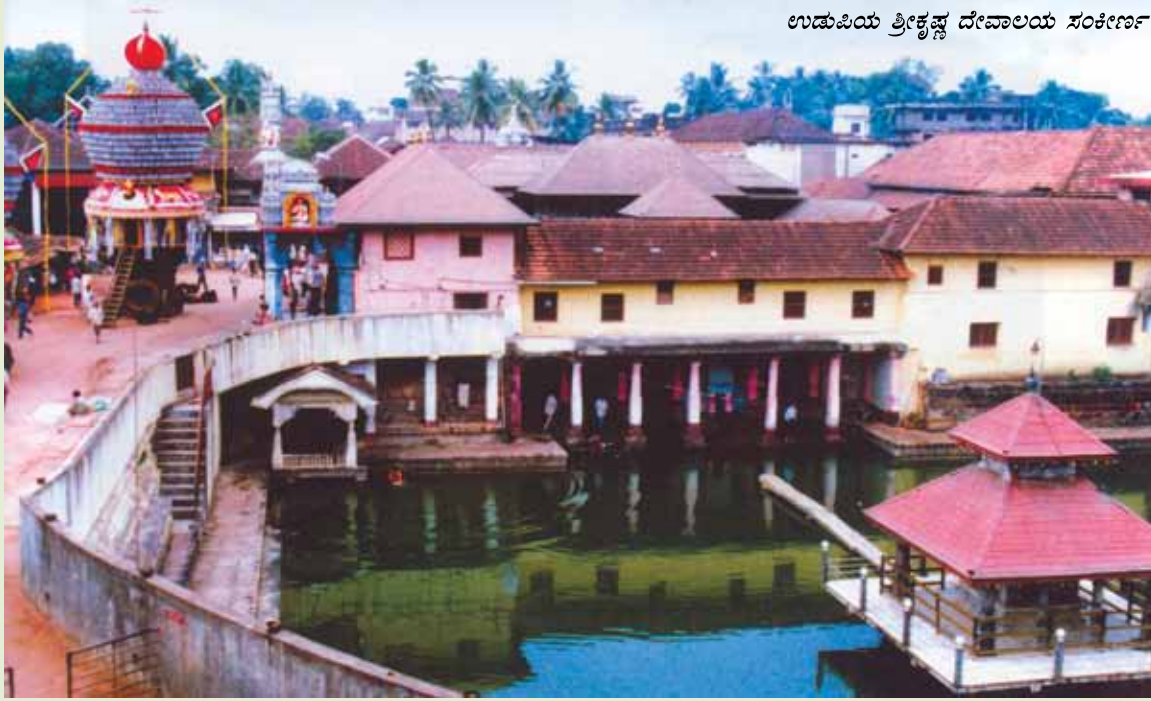
ಉಡುಪಿಯ ಶ್ರೀಕೃಷ್ಣ ದೇವಾಲಯ ಸಂಕೀರ್ಣ

ಅರ್ಥವಾಗುವ ಸುಶ್ರಾವ್ಯ ಕನ್ನಡ ಪದ್ಯಗಳ ಮೂಲಕ ಆರ್ಯ, ವೇದ ಹಾಗೂ ಉಪನಿಷತ್ತುಗಳ ಚಿಂತನೆಗಳನ್ನು ತಿಳಿಸಿದುದಕ್ಕಾಗಿ ಕರ್ನಾಟಕದಾದ್ಯಂತ ಜನಪ್ರಿಯವಾಗಿವೆ. ಶ್ರೀ ವ್ಯಾಸರಾಜ ಹಾಗೂ ಪುರಂದರರು ಚೈತನ್ಯ, ಕಬೀರ್, ತುಳಸೀದಾಸ, ವಲ್ಲಭಾಚಾರ್ಯ ಹಾಗೂ ಏಕನಾಥರ ಸಮಕಾಲೀನರಾಗಿದ್ದು ಅವರಂತೆಯೇ, ಸಾಮಾನ್ಯ ಜನರಲ್ಲಿ ಭಕ್ತಿ ತತ್ವಚಿಂತನೆಯನ್ನು ಪ್ರಚಾರ ಮಾಡಿದರು. ಶ್ರೀ ವಾದಿರಾಜರು ಕುಂಭಾಸಿಯ (ದಕ್ಷಿಣ ಕನ್ನಡ ಜಿಲ್ಲೆ) ಹೂವಿನಕೆರೆಗೆ ಸೇರಿದ್ದು ಧರ್ಮಸ್ಥಳದ ಶ್ರೀ ಮಂಜುನಾಥ ಸ್ವಾಮಿಯ ದೇವಾಲಯದ ಸಂಸ್ಥಾಪಕರೆಂದು ಹಾಗೂ ಉಡುಪಿಯಲ್ಲಿ ಅಷ್ಟ ಮಠಾಧಿಪತಿಗಳ ಅಡಿಯಲ್ಲಿ ಪೂಜಾ ವಿಧಾನದ ಪುನರ್ವ್ಯವಸ್ಥೆಯನ್ನು ಮಾಡಿದರೆಂದು ಅರಸಪ್ಪ ನಾಯಕನ ಅವಧಿಯಲ್ಲಿ, ಶಿರಸಿಯ ಪುನರ್‌ರಚನೆಯಲ್ಲಿ ನಿಜಕ್ಕೂ ನೆರವಾದರೆಂದು ನಂಬಲಾಗಿದೆ.