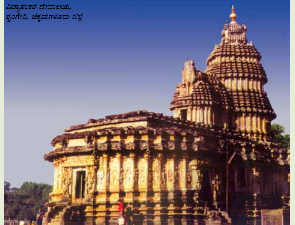
ವಿದ್ಯಾಶಂಕರ ದೇವಾಲಯ, ಶೃಂಗೇರಿ, ಚಿಕ್ಕಮಗಳೂರು ಜಿಲ್ಲೆ

ಬಾದರಾಯಣನ ಬ್ರಹ್ಮಸೂತ್ರಗಳ ಪ್ರಕಾರ, ಕರ್ನಾಟಕದಲ್ಲಿ ಸಾಹಿತ್ಯಕ ಚಟುವಟಿಕೆಗಳು ಮುಂದುವರಿದರೂ, ವೇದ ಸಂಸ್ಕೃತಿಯ ಪರವಾದ ಬೃಹತ್ ಬದಲಾವಣೆಗಳು ಉಂಟಾದವು. ಸುಮಾರು ಕ್ರಿ.ಶ.೭೦೦ರಂತೆಯೇ ಶತಮಾನದ ವೇಳೆಗೆ, ವೇದಾಂತ ಚಿಂತಕರ ಪೈಕಿ ಅತ್ಯಂತ ಮಹಾನ್ ವ್ಯಕ್ತಿಯಾದ ಹಾಗೂ ಬ್ರಹ್ಮಸೂತ್ರಗಳಿಗೆ ಭಾಷ್ಯವನ್ನು ಬರೆದು, ಇತರ ಎಲ್ಲ ಚಿಂತನಾ ವ್ಯವಸ್ಥೆಗಳಲ್ಲಿನ ಲೋಪದೋಷಗಳನ್ನು ಎತ್ತಿಹಿಡಿದ ಶಂಕರಾಚಾರ್ಯರ ಕೇರಳದಲ್ಲಿ ಜನಿಸಿದರು. ಶಂಕರಾಚಾರ್ಯರು ದೇಶದಲ್ಲೆಡೆ ಸಂಚರಿಸಿ, ಅದ್ವೈತ ವೇದಾಂತವನ್ನು ಸ್ಥಾಪಿಸಿದರು. ಶಂಕರಾಚಾರ್ಯರು ಜ್ಞಾನ ಮಾರ್ಗವನ್ನು ಸ್ಥಾಪಿಸಿ, ಉಪನಿಷತ್ತುಗಳಿಗೆ ಅತ್ಯಂತ ಸಾಂಪ್ರದಾಯಿಕ ಹಾಗೂ ಸಾಧಾರವಾದ ಅರ್ಥಕಲ್ಪನೆಯನ್ನು ನೀಡಿದರು. ಮಾಯೆಯ ಸಿದ್ಧಾಂತದೊಂದಿಗೆ ಬೆಸೆದ ಆಧ್ಯಾತ್ಮಿಕ ಅದ್ವೈತವನ್ನು ಅವರು ಪ್ರತಿಪಾದಿಸಿದರು. ಅವರ ಪದ್ಧತಿಯ ಸ್ಫುಟವಾದ ಅಂಶವೆಂದರೆ ಪ್ರಸ್ಥಾನತ್ರಯ, ಉಪನಿಷತ್ತುಗಳು, ಭಗವದ್ಗೀತೆ ಹಾಗೂ ವೇದಾಂತ ಸೂತ್ರಗಳ ವ್ಯಾಖ್ಯಾನ; ಇದರ ಪ್ರಕಾರ, ಭೌತಿಕ ಪ್ರಪಂಚವು ಒಂದು ಮಾಯೆಯಾಗಿದ್ದು, ಅಜ್ಞಾನದಿಂದ ನಿಜವಾದ ಜ್ಞಾನದಡೆಗೆ ಸಾಗಿದಾಗ, ಮುಕ್ತಿಯನ್ನು ಪಡೆಯಬಹುದು.